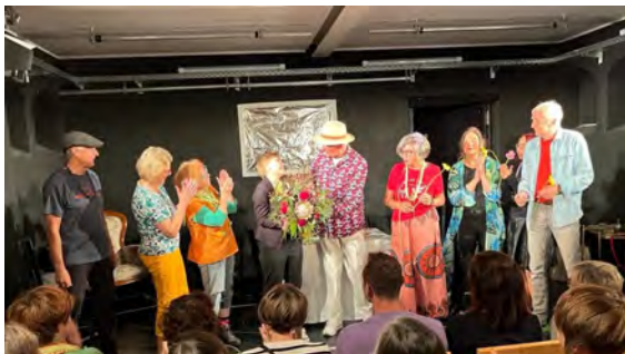
Senioren-Theater-Gruppe „Die Theatralischen“